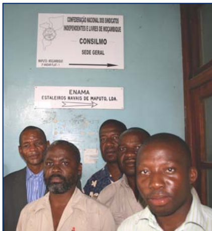
Colaboração entre representantes da CONSILMO e a Health Policy Initiative.

Sindicatos reivindicam direitos e negociam políticas de HIV no local de trabalho nas negociações colectivas anuais.